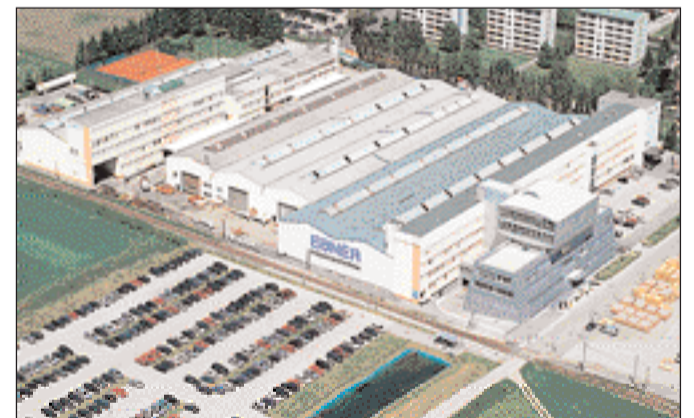
Ebner feiert heuer sein 60-jähriges Bestehen

Dabei ist ein harmonisches Zusammenspiel von Natur, Produkt, Mensch und Kultur wichtig.