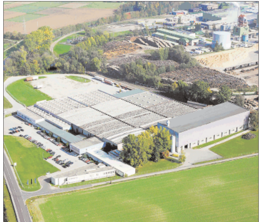
Smurfit Kappa Interwell mit Sitz in Nettingsdorf

Die Zugehörigkeit zum internationalen Smurfit Kappa Konzern ermöglicht beiden Unternehmen, ihren Kunden das gesamte Verpackungs-Know-how der Gruppe zur Verfügung zu stellen. Das Smurfit Kappa InnoBook zum Beispiel ist eine konzernweite Datenbank, welche die innovativsten Verpackungen aller Smurfit Kappa Standorte zusammenfasst. Dieses dient als einzigartige Unterstützung für das Team der Ver-